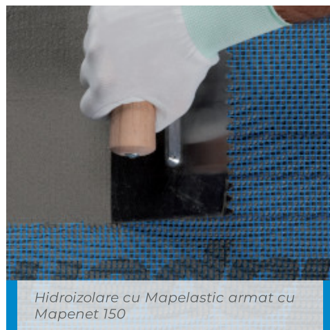
Hidroizolare cu Mapelastic armat cu Mapenet 150